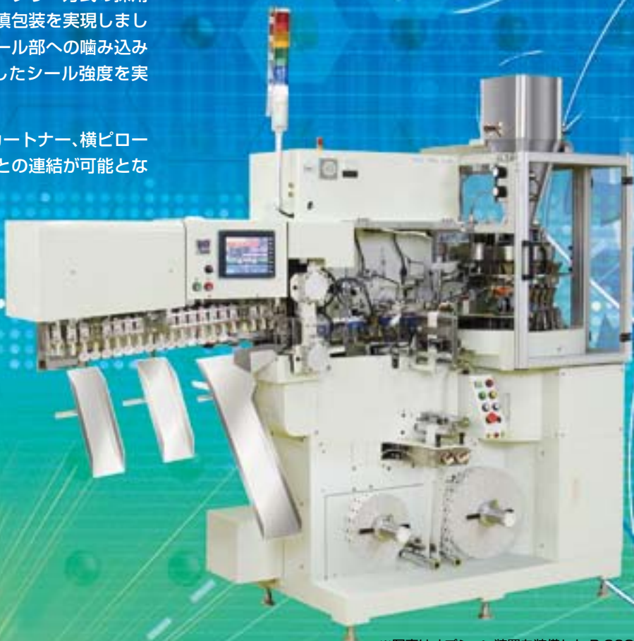
※写真はオプション装置を装備した R-36G