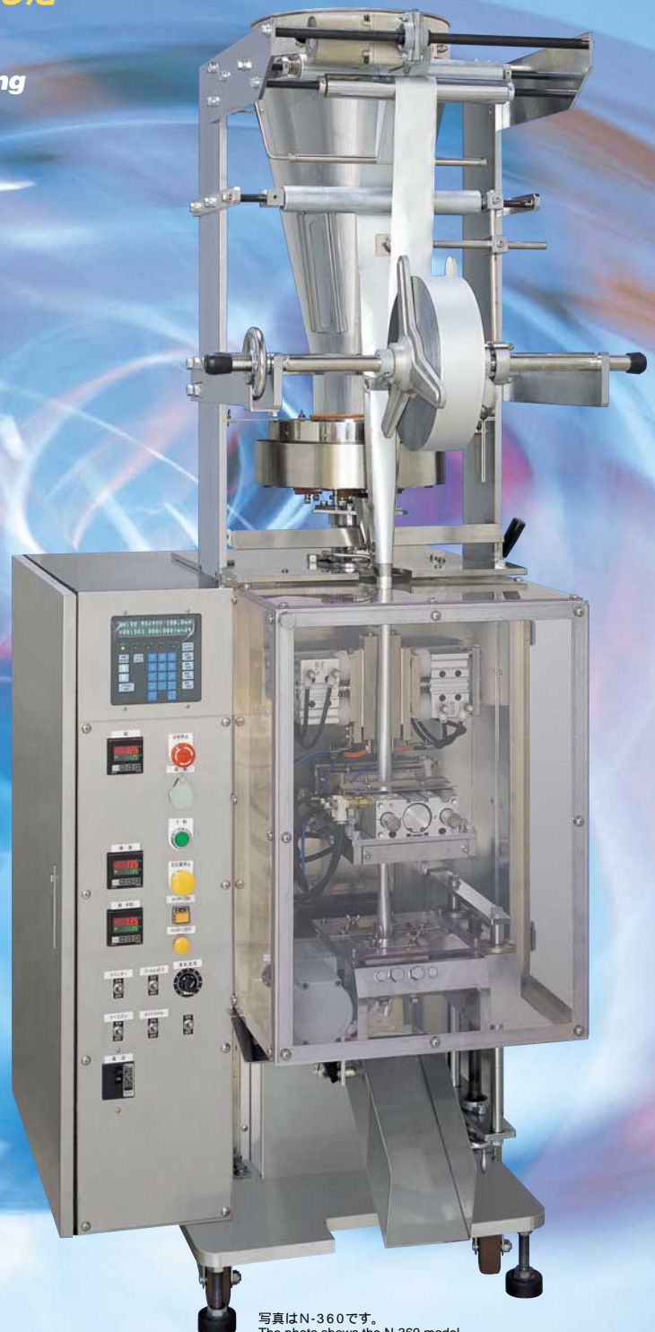
写真はN-360です。 The photo shows the N-360 model.

Covers are provided for potentially dangerous sections that can cause burns, entanglement or cuts. When a cover is opened, the machine operation stops to ensure safety.